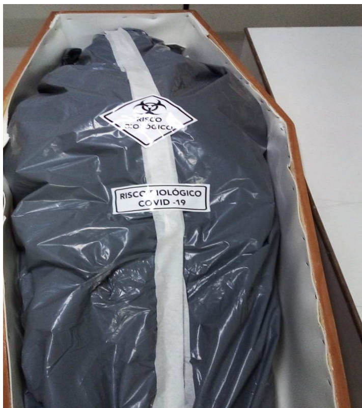
Fig. 3: Urna aberta, saco selado e identificação de risco biológico (quando houver)

6 – Em razão das medidas para enfrentamento à pandemia da Covid-19, a CAF vem adotando vistorias remotas na autorização do traslado de corpos, por meio do envio de duas fotos à equipe de vistoria pelo aplicativo WhatsApp. Para tal, são consideradas imagens válidas aquelas que forem encaminhadas em boa resolução, com foco e nitidez preservados. A primeira foto (figura 3), angulada de cima para baixo, tem de mostrar a urna de madeira aberta contendo o corpo acondicionado no saco cadavérico ou invólucro similar, devidamente selado, sobre o qual deve estar afixada a identificação do risco biológico (quando houver). A segunda foto deve mostrar a urna fechada, tendo sobre sua tampa ou ao lado dela (figuras 4 e 5) um documento de identificação do falecido, que pode ser a Certidão de Óbito. Importante checar antes do envio que é possível visualizar o nome no documento, a partir de zoom ampliado. O envio das fotos não representa a validação do procedimento. Para isso, é necessária a sinalização positiva do vistoriador, que poderá, se julgar necessário, requerer o envio de outras imagens para a devida confirmação.