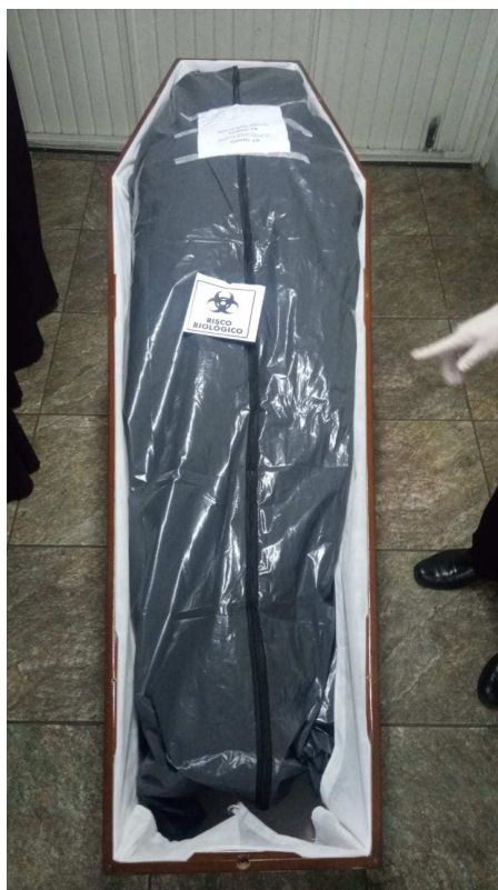
Fig. 1: Saco cadavérico com zíper